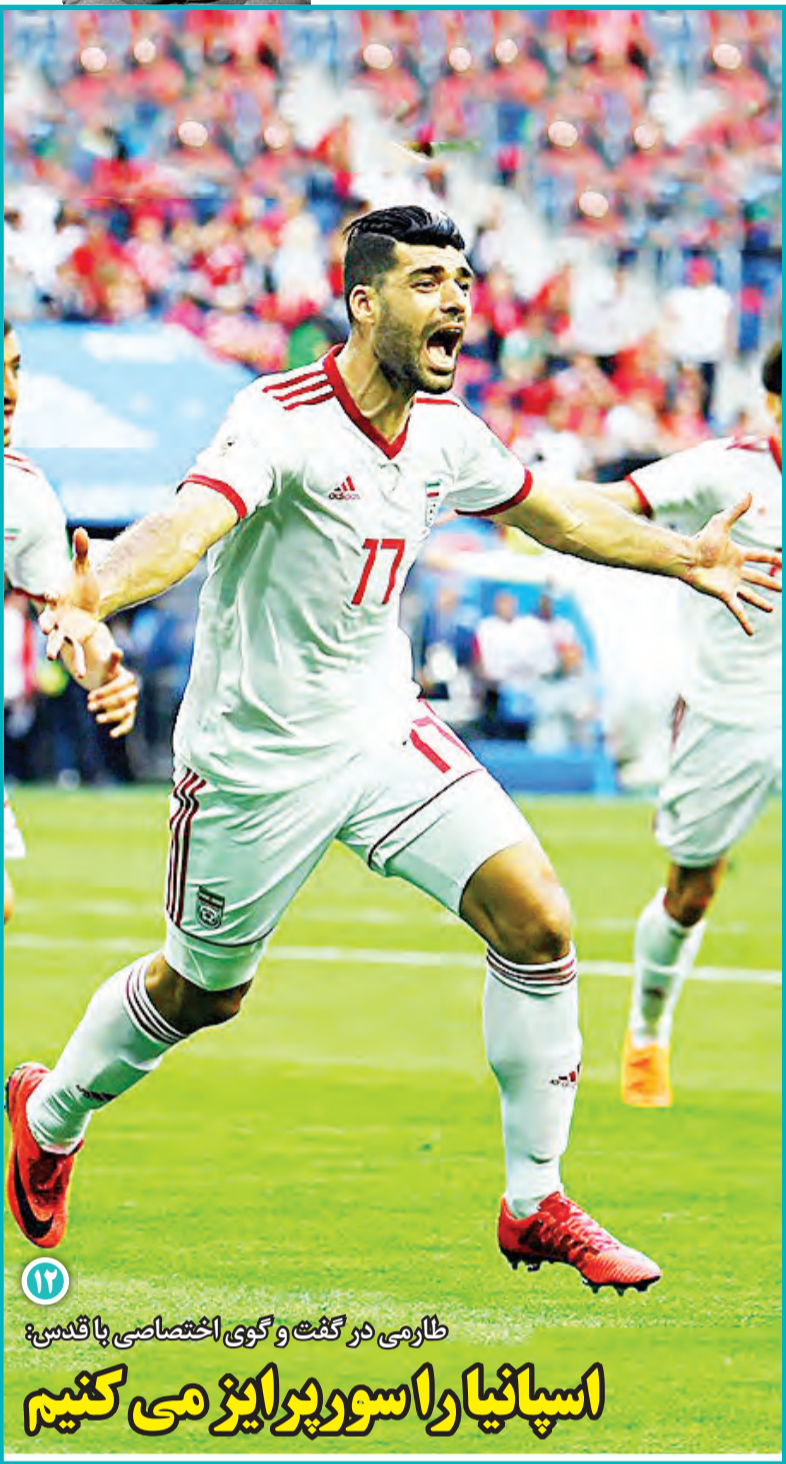
ظارمی در گفت و گوی اختصاصی با قدس

نگاهی به سریال «کلاه پهلوی» به بهانه بازپخش آن از شبکه افق کلاه برداری پهلوی