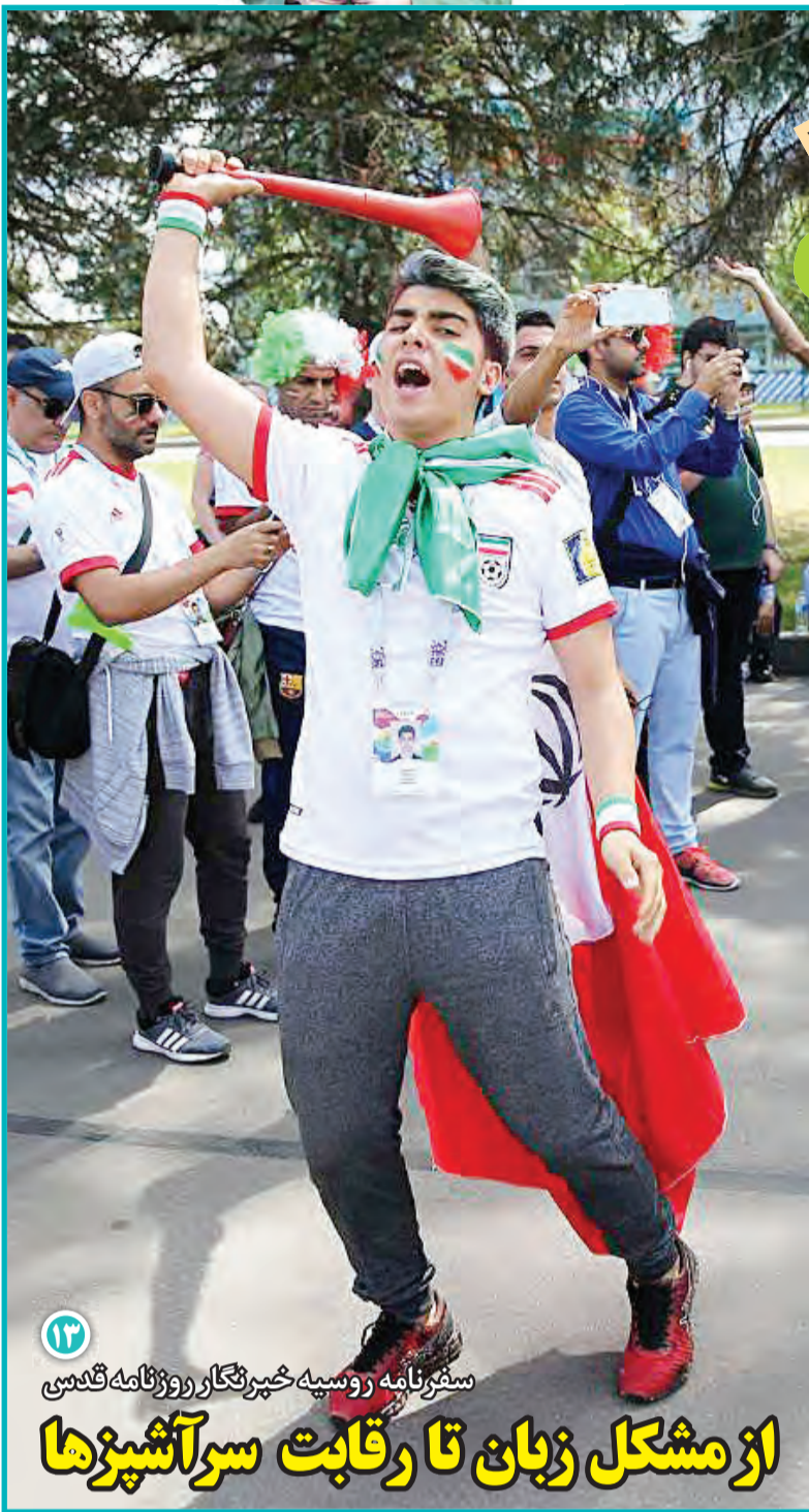
سفرنامه روسیه خبرنگار روزنامه قدس