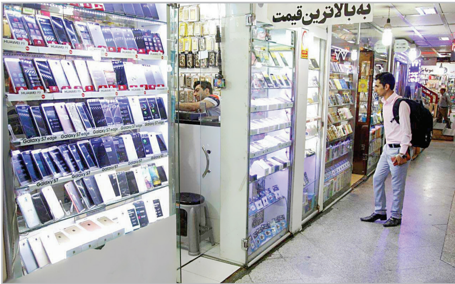
به بالاترین قیمت

گزارش قدس از بی رونقی دادوستد گوشی در مشهد