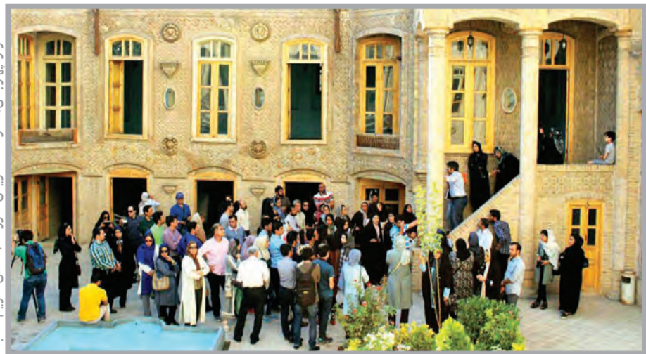
قرار چهاربانه ها در خانه تاریخی داروغه

جامعه/ محبوبه علی پور ۱ با انتشار خبر تخریب بناهای تاریخی موحی از تأسفد در جامعه حاکم می شود که چرا سازمان های متولی برای دوام این مجموعهها چاره اندیشی نمی کنند؟ و البته نخستین پاسخ نیز به «نبود اعتبارات کافی» ختم می شود. این در حالی است که امروزه صدها بنای تاریخی در جهان از محل بازدید گردشگران به درآمدهای قابل توجهی رسیدند.