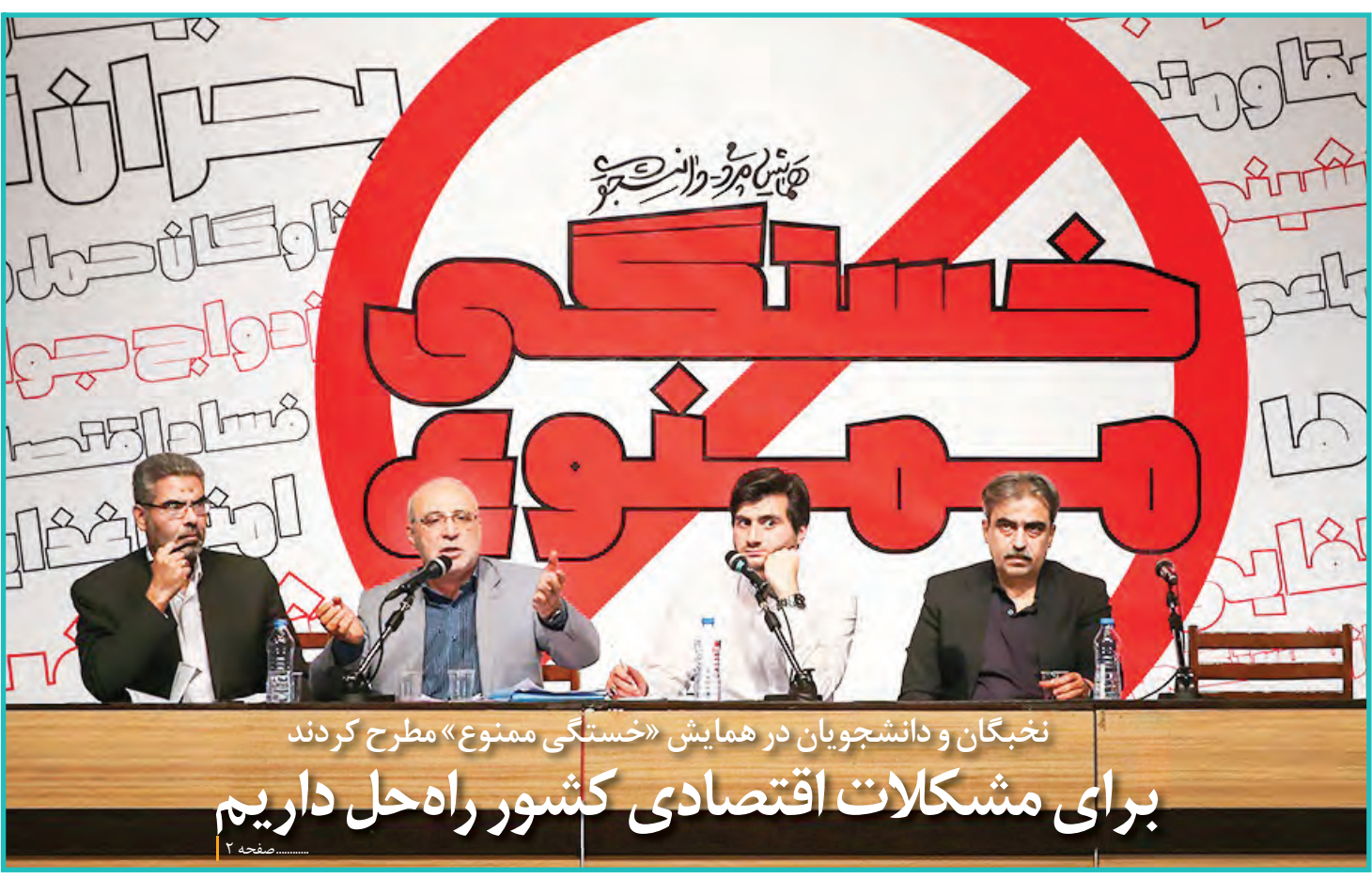
نخبگان و دانشجویان در همایش «خستگی ممنوع» مطرح کردند برای مشکلات اقتصادی کشور راه حل داریم