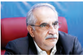
امیر اسفندیار آصفی

میزان ؛ توزیر اقتصاد و دارایی از سه فرمان برای دریافت مالیات از واردکنندگان خودرو با ارز ۴۲۰۰ تومانی و خریداران سکه خبر داد و گفت: دولت در راستای تأمین منافع ملی، حرکت در مسیر توسعه و حفظ منافع شهروندان و کارآفرینان و بسا تکیه بر «قدرت حکمرانی» خود از منابع کشور پاسداری می‌کند.