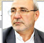
امیر اسفندیار آصفی، رئیس‌کل بانک مرکزی

امیر اسفندیار آصفی بر عدم تحقیق و تفحص از بانک مرکزی تسلیم ؛ عضو کمیسیون برنامه و بودجه با بیان اینکه اتهامات اخیر ارزی ارتباطی با استیضاح وزیر اقتصاد ندارد از اصرار سوال برانگیز سیف برای عدم تحقیق و تفحص از بانک مرکزی خبر داد. دلگامی محض شد؛ رئیس کل بانک مرکزی چندین بار اصرار کرد تا بحث تحقیق و تفحص از بانک مرکزی به جریان نیفتد. هر بار که ایشان اصرار می‌کردند ما نیز بیشتر واقف می‌شدیم که حتماً مسائل مهمی وجود دارد که این دوستان متمایل به شفاف شدن آن نیستند.