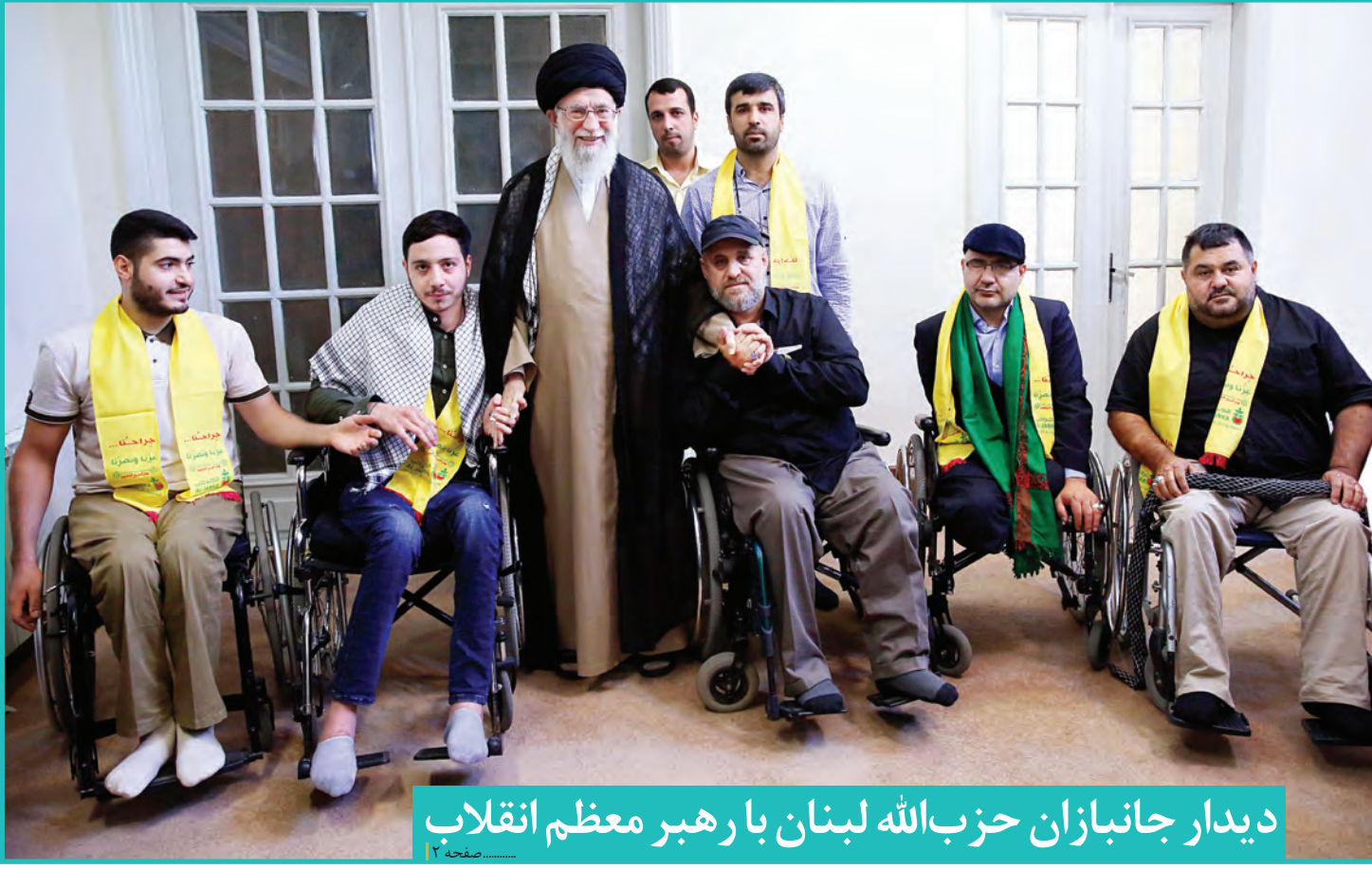
دیدار جانبازان حزب الله لبنان با رهبر معظم انقلاب

قدس از راهکارهای تمرکززدایی ثروت و کاهش شکاف طبقاتی گزارش می‌دهد سه گام مالیاتی برای توزیع عادلانه درآمد صفحه ۴