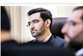
امیر اسفندیار آصفی

ایلتنا ؛ توزیر ارتباطات از نصب نمایشگر میزان پارازیت در برخی شهرهای کشور خبر داد. محمد جواد آذری جهرمی در پاسخ به پرسشی در باره کم فروشی حجم اینترنت از سوی اپراتورها تلفن همراه گفت: در حال حاضر گزارش جدیدی مبنی بر اینکه مشترکان حجمی را خریداری کرده اما شرکتی کمتر از آن میزان را تحویل داده باشد، دریافت نشده است. وی درباره تغییر و خلاقیت در مدل‌های فروش خدمات ارتباطی و اینترنتی تلفن همراه نیز گفت: اپراتورها حق ندارند بسته‌ای را به مشترک تحمیل کنند، اما در قالب سفتی که در مقررات تنظیم رادیویی مشخص شده می‌توانند بسته‌های ارائه شده را تغییر دهند.