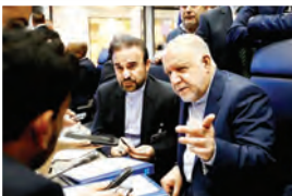
امیر اسفندیار آصفی

ایستا ؛ وزیر انرژی امارات متحده عربی در نامه‌ای به بیژن زنگنه، وزیر نفت و نفت عرضه: کمیته نظارت بر توافق عرضه اوپک و غیر اوپک، نحوه اقدام این گروه اتلافی برای کاهش سطح پایبندی به ۱۰۰ درصد را مورد ارزیابی و رصد قرار خواهد داد.