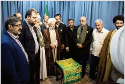
زیر سایه خورشید در دفتر آیت‌الله مصباح‌یزدی