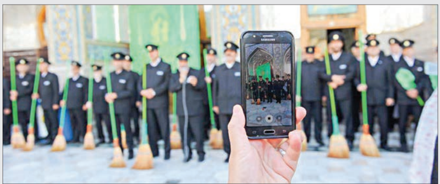
مراسم غبار رویی رونق‌ها به مناسبت دهه کرامت