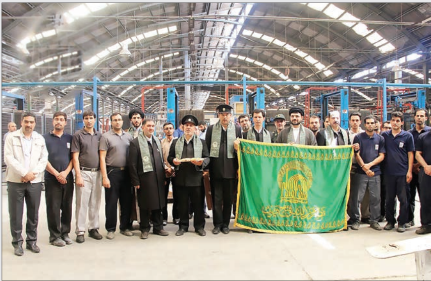
زیر سایه خورشید در کارخانه سینا کاشی اراک