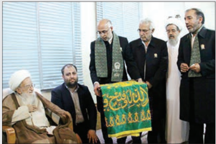
زیر سایه خورشید در دفتر آیت‌الله صالحی گلپایگانی