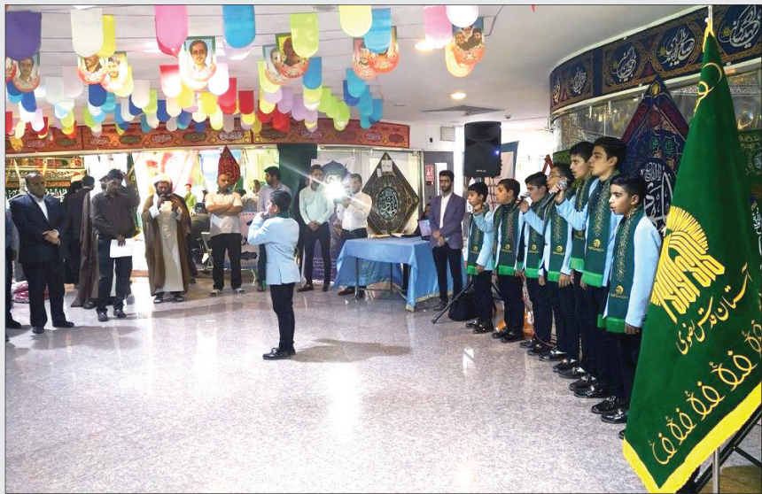
یازدید قائم مقام تولیت آستان قدس از نمایشگاه عرضه محصولات فرهنگی و هنری دهه کرامت (شهر کرامت)