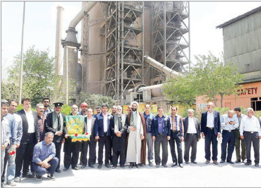
تکریم کارگران شرکت سیمان دورود استان لرستان توسط کاروان خادمان حرم امام رضا علیه السلام