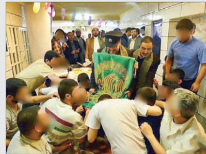
حضور کاروان زیرسایه خورشید در زمان مرکزی شیواز