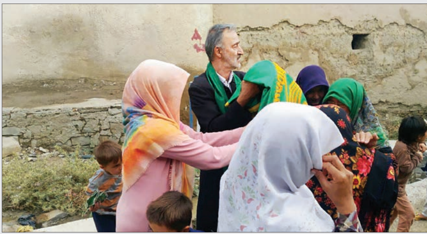
حضور پر خیر و برکت خادمان حرم رضوی به خراسان شمالی