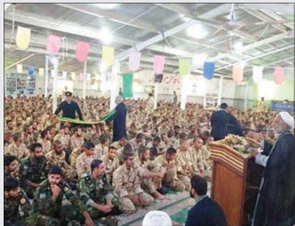
حضور پر سر موز شهدای گمنام و پرسنل و سرپایان یادگان آموزشی شهید بوری