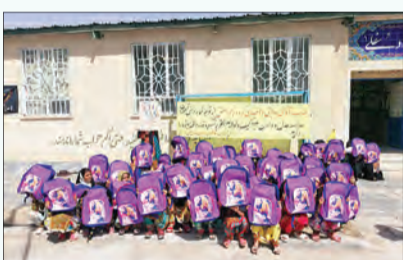
بالا: مشارکت «زنجیره عشق» در آب رسانی به جنوب کشمیر پایین: تأمین نوشت افزا ر‌های دانش آموزان مناطق محروم