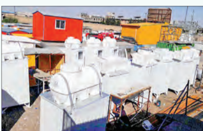
بالا: ارسال بسته‌های غذایی به مناطق محروم بلوچستان پایین: ارسال سرویس بهداشتی کانکسی به کرمانشاه