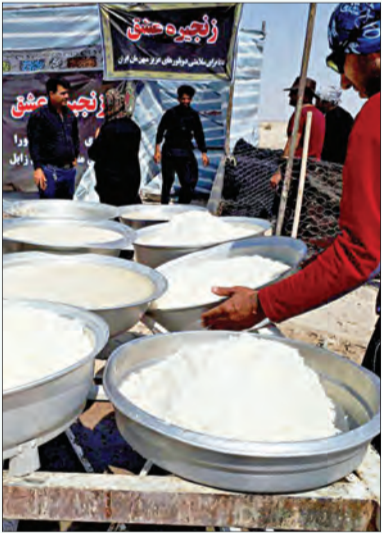
گروه «زنجیره عشق»؛ امسال نذری های محرشان را به سیستان بردند

سعی کردیم نذری‌ها را به مناطق محروم ببریم