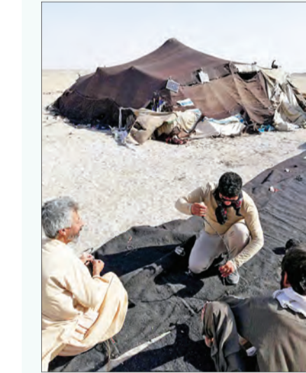
«زنجیره عشق»؛ برای کمک به مناطق محروم حتی به دوخت سیاه چادر هم کمک می‌کند