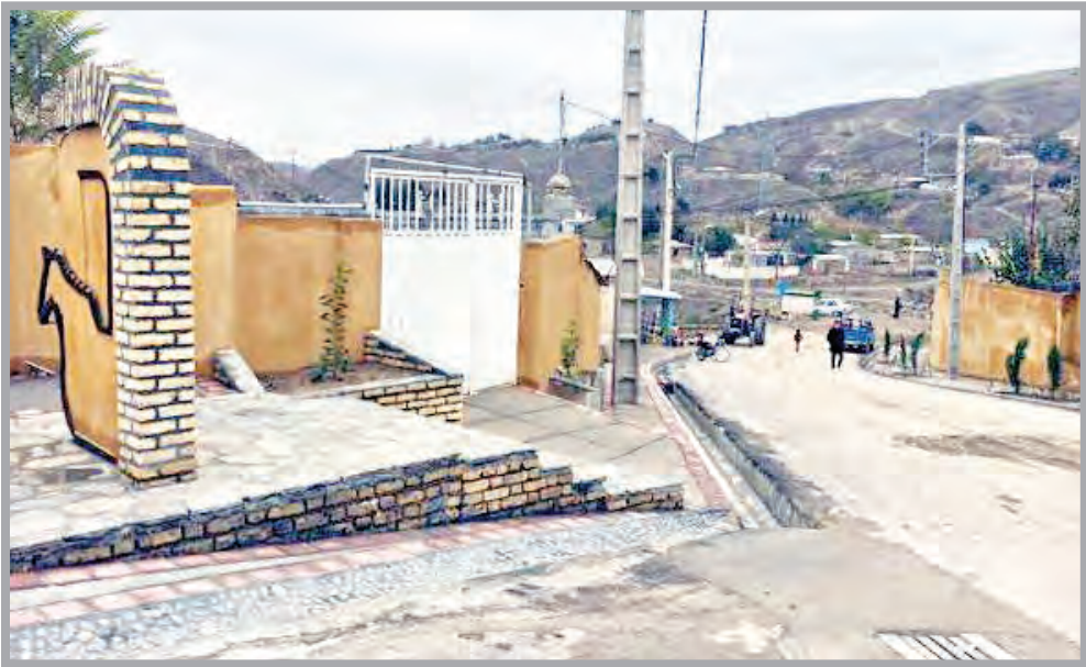
طرح هادی در بن بست اعتبار و نگاه‌های سلیقه‌ای