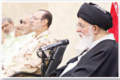
آیت‌الله علم‌الهدی در دیدار با فرماندهان انتظامی خراسان رضوی.

فارس: نماینده ولی فقیه در خراسان رضوی گفت: شاید به‌اندازهای که فعالیت‌های اطلاعاتی و آگاهی در حوزه نظم و امنیت خراسان رضوی موضوعیت دارد، در سایر نقاط کشور ندارد. آیت‌الله سید احمد علم‌الهدی در دیدار با فرماندهان انتظامی خراسان رضوی که بهمناسبت هفته نیروی انتظامی برگزار شد؛ گفت: ممکن است پلیسی کارآمدتر از جریان پلیس کشور ما باشد، اما پلیسی مقدس‌تر از پلیس این نظام روی کره زمین نیست، چرا که در همه کشورها سالت پلیس حفظ نظم و امنیت در جامعه است، اما پلیس مقدس ما رسالتش غیر از نظم و امنیت، دفاع از یک جریان صدرصد دینی، الهی و وابسته به‌ذات پروردگار و شریعت اسلام است.