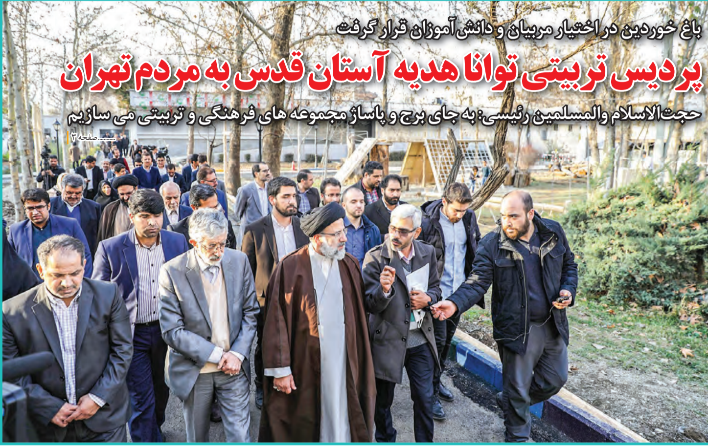
باغ خوردهین در اختیار مریبان و دانش آموزان قرار گرفت پر دسی تربیتی توانا هدیه آستان قدس به مردم تهران حجت الاسلام والمسلمین رئیسی: به جای برج و پاساژ مجموعه های فرهنگی و تربیتی می سازیم