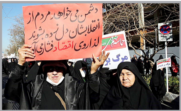
مقدس و مدافع حرم