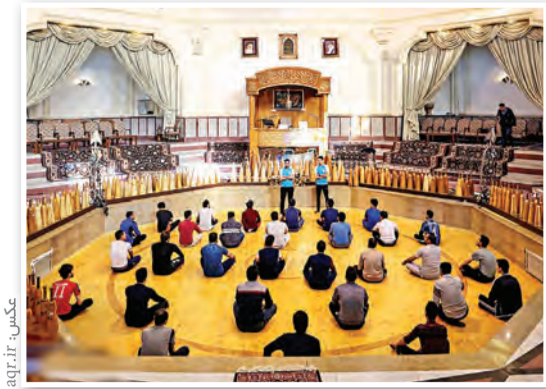
همایش زندگی به سبک رضوی با عنوان ورزش و سلامت در خانواده در مجتمع تربیت بدنی آستان قدس رضوی برگزار شد.

اولین جشنواره سراسری آکیلا «آوای رضوان» برگزار می‌شود... اولین جشنواره سراسری آکیلا «آوای رضوان» به همت مؤسسه آفرینش‌های هنری آستان قدس رضوی با همکاری شبکه امید برگزار می‌شود.