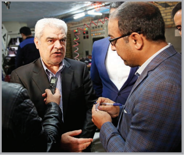
عصر غیر مشاهذ مغفرازده

گزارش‌های قدس معاون وزیر را به مشهد کشاند وعده حل مشکلات فاضلاب چرمشهر تا ۹ ماه آینده