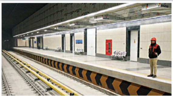
تأمین شده و تمام و کمال به دست ما رسیده و مشکلی نداریم.