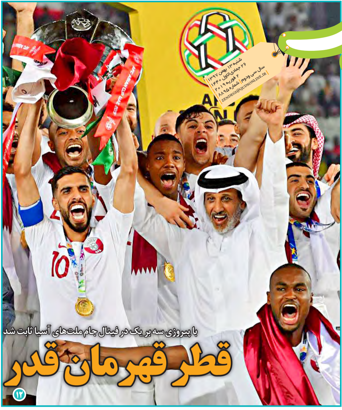
با پیروزی سه بر یک در فینال جام ملت‌های آسیا ثابت شد