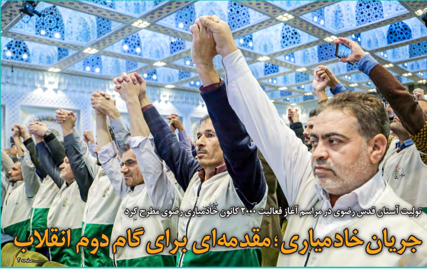
تولیت آستان قدس رضوی در مراسم آغاز فعالیت ۲۰۰۰ کانون خادمیاری رضوی مطرح کرد جریان خادمیاری؛ مقدمه ای برای گام دوم انقلاب

رئیس دفتر روحانی بار دیگر در پاسخ به انتقادهای پای دولت دهم را وسط کشید طراحان استیضاح زیر تیغ انتقاد دولتی ها