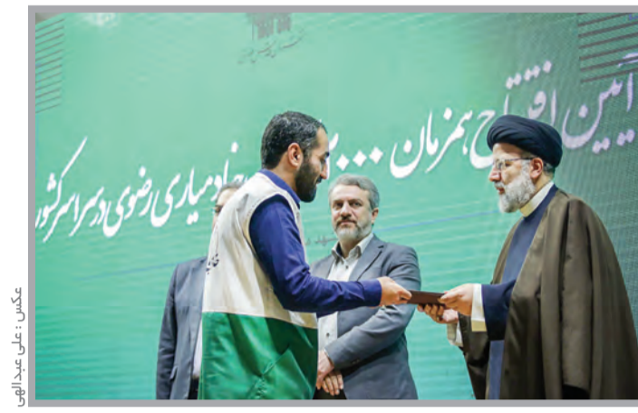
تولیت آستان قدس رضوی در جریان این مراسم با مدیران کانون خادمیاری رضوی گفت‌وگو می‌کند.

عاشق و علاقه‌مند خدمت به ساحت مقدس رضوی از جمله اقدامات شایسته و مؤثر در دوران تولیت حجت الاسلام والمسلمین رئیسی بوده است. مدیر دفتر نمایندگی آستان قدس رضوی در خراسان شمالی هم گفت: حدود ۵۰۰۰ نفر از خادمیاران رضوی در این استان ثبت‌نام کرده‌اند که از این تعداد ۳۰۰۰ نفر مراحل ثبت نام و تأیید و بیه کارگیری آنان انجام و ۱۲۶۲ نفر هم مورد و مصداق خدمتی خود را مشخص کرده و ۸۰۰ نفر هم ماهیانه طبق ضوابط در حرم مطهر رضوی توفیق خدمت دارند.