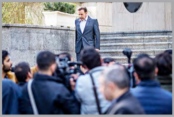
فاطمی - فارس

امیری تصریح کرد: «من خیلی امیدوارم که دوستان ی که طرح استیضاح آن مطرح کردند به شرایط امروز کشور توجه نمایند و به نحوی عمل کنند که دشمن نامید و داخلی ها امیدوار شوند. سؤال، استیضاح و تحقیق و تفحص حق نمایندگان است اما شناختن این روش و زمان استفاده کردن از این حق نیز بسیار مهم چنین مباحثی را مطرح می‌کنند.»