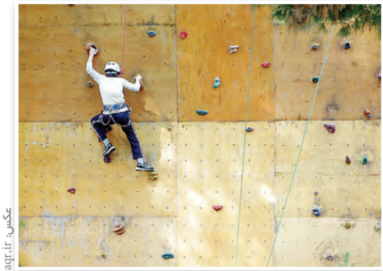
پسران قرآن آموز بر تر طرح حافظون رضوی در اردوی مجتمع فرهنگی امام رضا (ع) شرکت کردند و تقدیر شدند