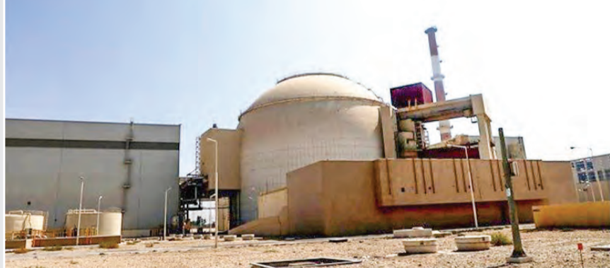
ورود دوباره نیروگاه اتمی بوشهر به مدار تولید برق

تسنیم: مدیرعامل شرکت بهره‌برداری نیروگاه اتمی بوشهر با اشاره به تعطیلی نیروگاه بوشهر برای برخی تعمیرات و جابه‌جایی سوخت گفت: نیروگاه اتمی بوشهر از نیمه نخست اردیبهشت سال آینده دوباره وارد مدار تولید برق می‌شود.