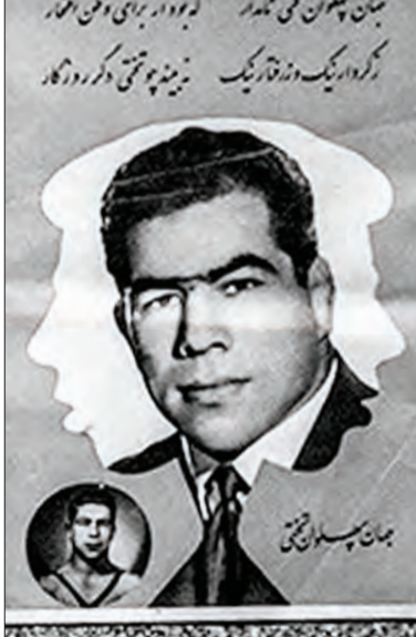
جهان پهلوان همیشه جهان پهلوان بوده و خواهد بود. هیچ قدرتی نمی‌تواند آقا تختی را خراب کند. اگرچه نخبه کشی رسم شده است.