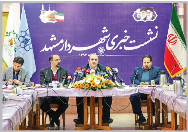
پاسخ: امیر حسین صاحبکار