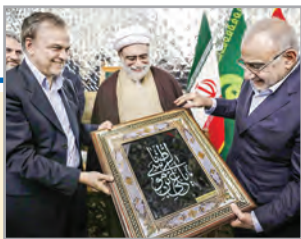
یادداشتی از مهدی غلامی