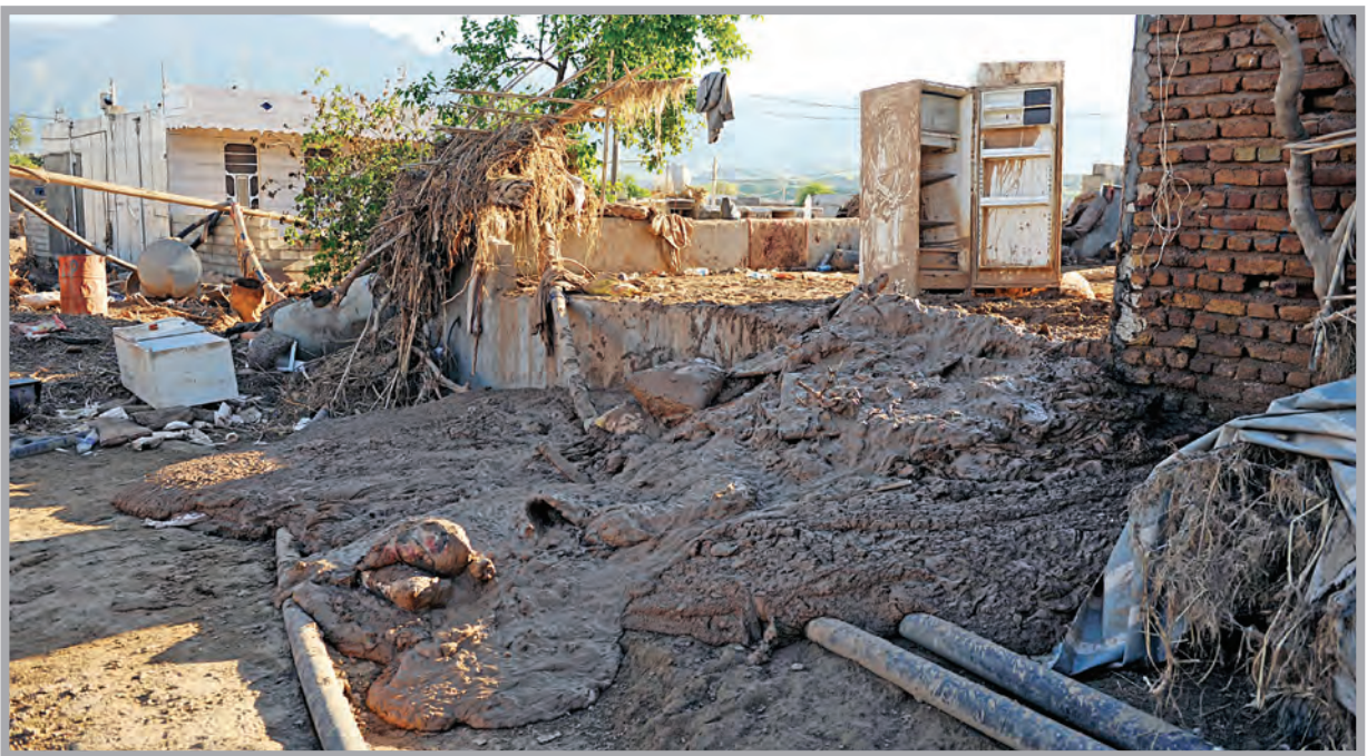
تکس : صحنه‌ای کام‌خوار / قدس

اخرم‌آباد / قدس | لرستان که در سال جدید چشم امید به رونق صنعت گردشگری و فرا رسیدن بهار و استقبال از مسافران داشت این روزها مردمانش را به دلیل خرابی‌های برجای‌مانده از سیل در مشکلات غرق کرده است.