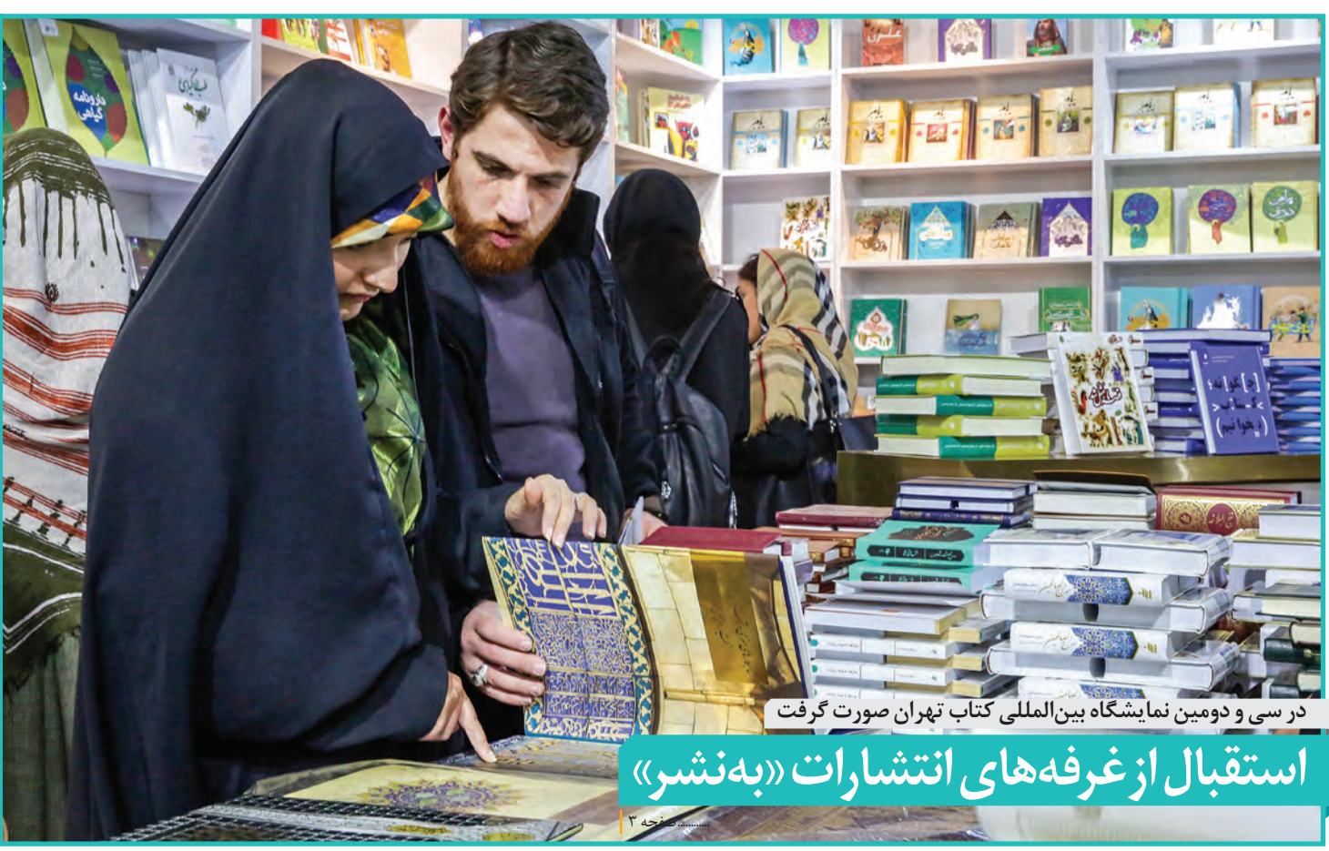
در سی و دومین نمایشگاه بین‌المللی کتاب تهران صورت گرفت استقبال از غرفه‌های انتشارات «به‌نشر»

درخواست دیده‌بان شفافیت و عدالت از حجت‌الاسلام والمسلمین رئیسی: تجربه شفاف‌سازی در آستان قدس را به قوه قضائیه بیاورید