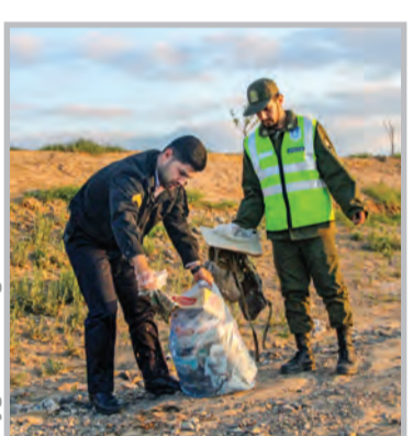
محیطی سالم و تمیز، اگر پارکینگ های کنار جاده ها تمیز باشد، راننده های عبوری زمانی که احساس خستگی می کنند وقتی به پارکینگ تمیزی برسند رغبت

می کنند و می ایستند اما اگر پارکینگ کنار جاده کثیف و مملو از زباله باشد، شاید آن راننده با وجود خستگی و خواب آلودگی نایستد و تا رسیدن به پارکینگ بعدی، اتفاق ناگواری بیفتد و جان یک یا چند نفر به مخاطره بیفتد، بعد از شنیدن این پاسخ خوب و منطقی، دیگر جز گفتن احسنت و خدایقوت، مطلب دیگری به ذهن نرسید و خوشحال از رؤیت این صحنه زیبا و ثبت آن، محل را ترک گفتم. همه ما پلیس راه را با برکه های جریماهش می شناسیم اما امروز این مطلب را نوشتم تا بگویم شاید همه ما روزی برای انجام تخلف رانندگی، بپه جریماه افسر پلیس به تمنان خورده باشد، اما خوب است بدانیم در کشوری زندگی می کنیم که پلیس اش، شاید طبق وظیفه ذاتی و نیز برای سلامت تک تک شهروندان می اندیشد و کاری که حتی وظیفه اش نیست را در نهان انجام می دهد. خدایقوت به تو و همه نیروهای انتظامی و نظامی خوب ایران عزیز.