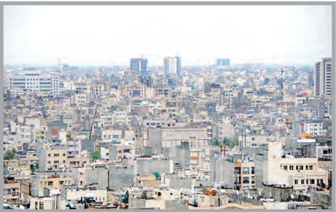
تکس: محمد علی رضایی

این توضیحات اما مانع از مخالفت دولت، کمیسیون عمران به عنوان کمیسیون فرعی و بعد هم برخی کارشناسان حوزه مسکن و اقتصاد کلان با این طرح نشده است. دولت اعلام کرده به دنبال لایحه‌ای جامع برای اخذ مالیات بر عایدی سرمایه و از جمله سرمایه املاک است و اعضای