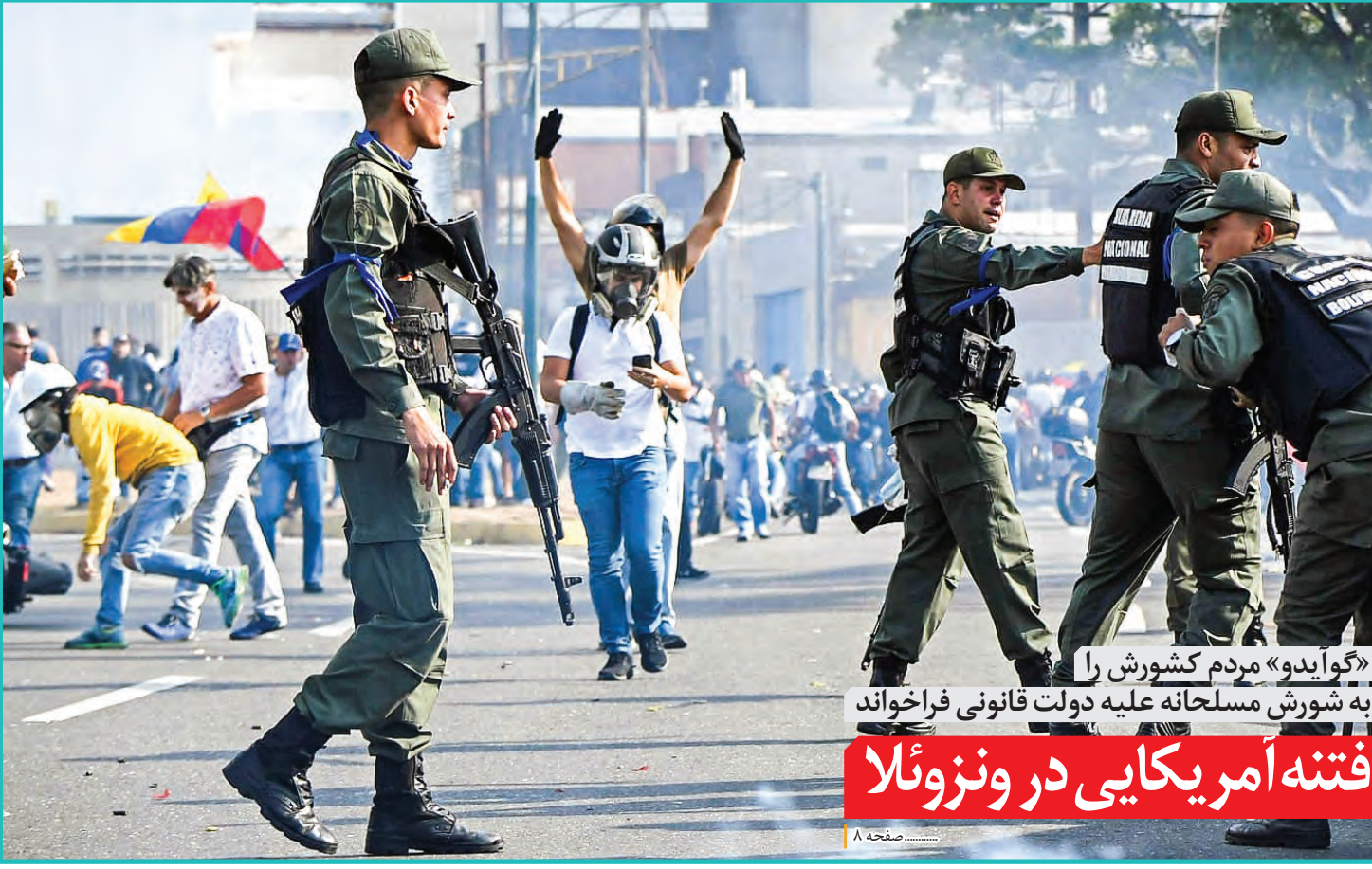
«گوایدو» مردم کشورش را به شورش مسلحانه علیه دولت قانونی فراخواند فتنه آمریکایی در ونزوئلا

مدیر اینستکس از آمادگی برای نخستین تبادل تجاری با تهران خبر داد هشدارهای ایران اروپا را به تحریک واداشت!