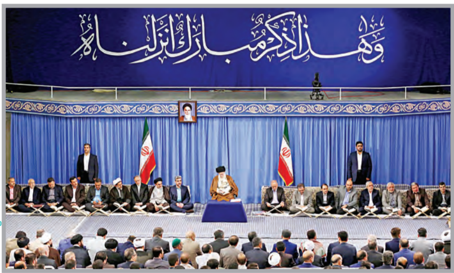
کتابخانه - کلام