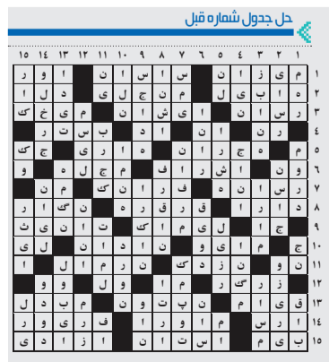
منتظر نظرها، دیدگاه‌ها و انتقاداتتان در خصوص جدول هشتم یا ما تماس بگیرید

۱. بتی در جاهلیت - پایتخت تزارها- درخور و شایسته ۲. از ملزومات طبخ آش- این پول در سونیس به کارتان می‌آید- صوت ندا ۳. خوپسند - غریب- هشت‌پا ۴. زادگاه رازی- بازگردانده شده- پرحرفی- اصغر اعداد ترتیبی دو رقمی ۵. رنگی از خانواده آبی- کش چرمی پاشنده‌دار- واحد شمارش عائله ۶. آبراهه باریک بین دو خشکی - قاره کهن- راهی ۷. نشانی- شاخه‌ای از ورزش شش- سرشیر ۸. هنر کننده‌کاری روی چوب- کشک ۹. کمانگیر باستانی ۱۰. مغازه- دلیل و علت چیزی یا کاری شدن ۱۰. عیب- چاق- سنگی سیلیسی و آبدار از دسته کانی‌های مجاور کوآرتز ۱۱. دشمن سرسخت- سیب ترکی-