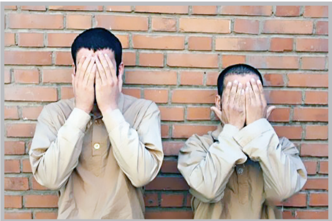
عقلم: فرزندان است

با اعلام وقوع سرفت مسلحانه گوشی تلفن همراه به اپراتور پلیس، مأموران به سرعت به محل اعزام و لحظاتی بعد در حوالی خیابان هاشمیه ۳۰ حاضر شدند. مالباخته که شاه‌ماش دچار جراحت بود به مأموران مراجعه و بدون معطلی شروع به تشریح نحوه سرفت کرد و گفت: جلوی مغازه‌ای ایستاده بودم که یک دستگاه موتورسیکلت چند متری من توقف کرد و ترک نشین موتور پیاده و درحالی که چاقو همراه داشت به سمت من حملهور و در یک چشم بیه هم زدن گوشی ۱۰ میلیون تومانی‌ام را از دستم چنگ زد و پا به فلان گذاشت. او بر ترک موتور پرید و همراه با همدستش با سرعت فرار کردند. اما کمی جلوتر از محل سرفت کنترل موتور از دست راکب آن خارج و با یک دستگاه خودرو تپیا که از رویه رو می‌آمد برخورد کرد و هر دو نقش بر زمین شدند. با دیدن این صحنه به سمت آن‌ها دویدم تا شاید بتوانم گوشی‌ام را پس بگیرم که یکی از سارقان به محض دیدنم از جا بلند شد