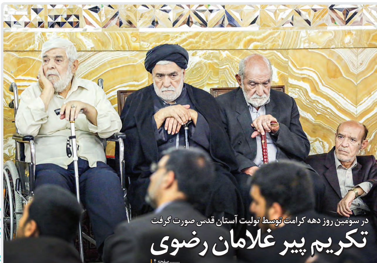
در سومین روز دهه کرامت توسط تولیت آستان قدس صورت گرفت تکریم پیر غلامان رضوی

با حضور کاروان‌های «زیر سایه خورشید» جشن‌های ویژه دختران در ۸ استان کشور برگزار شد کتابخانه‌های آستان قدس رضوی از خدمات متنوع کتابخانه‌های آستان قدس رضوی است میهمانی که دانایی سوغات می‌آورد اعضای کاروان «زیر سایه خورشید» در خیرگزاری‌ها رسانه‌های میزبان پرچم متبرک بارگاه منور رضوی