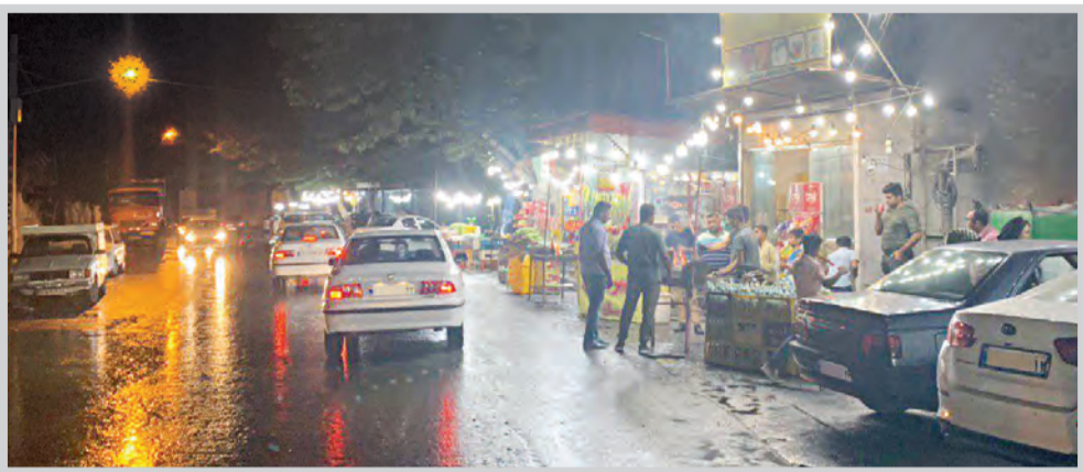
عکس تزئینی است

با قدس آنلاین اظهار کرد: کارهای کارشناسی و تصمیمات اولیه این موضوع انجام شده است و قیمت نان در نانواپی‌های یارانه‌ای و نیمه یارانه‌ای بر اساس وزن چونه مشخص و تغییر خواهد کرد. از طرفی در این موضوع ساماندهی قیمت‌ها و تعیین وزن چونه‌ها به صورت واحد و استاندارد نیز مطرح است زیرا در حال حاضر وزن چونه‌ها در نانواپی‌های مختلف متفاوت است. رئیس اتاق اصناف مشهد با بیان اینکه نانواپی‌های یارانه‌ای از سال ۱۳۹۴ با وجود افزایش هزینه‌های مختلف، افزایش قیمت نداشته‌اند، افزود: به محض نهایی شدن این موضوع در این کارگروه که به احتمال قوی در نیمه اول مهرماه باشد، قیمت‌های جدید توسط استاندارد خراسان رضوی به عنوان رئیس این کارگروه اعلام و اجرایی خواهد شد.