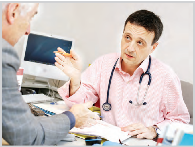
عکس تبلیغی است