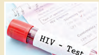
یک مسئول وزارت بهداشت بیان کرد