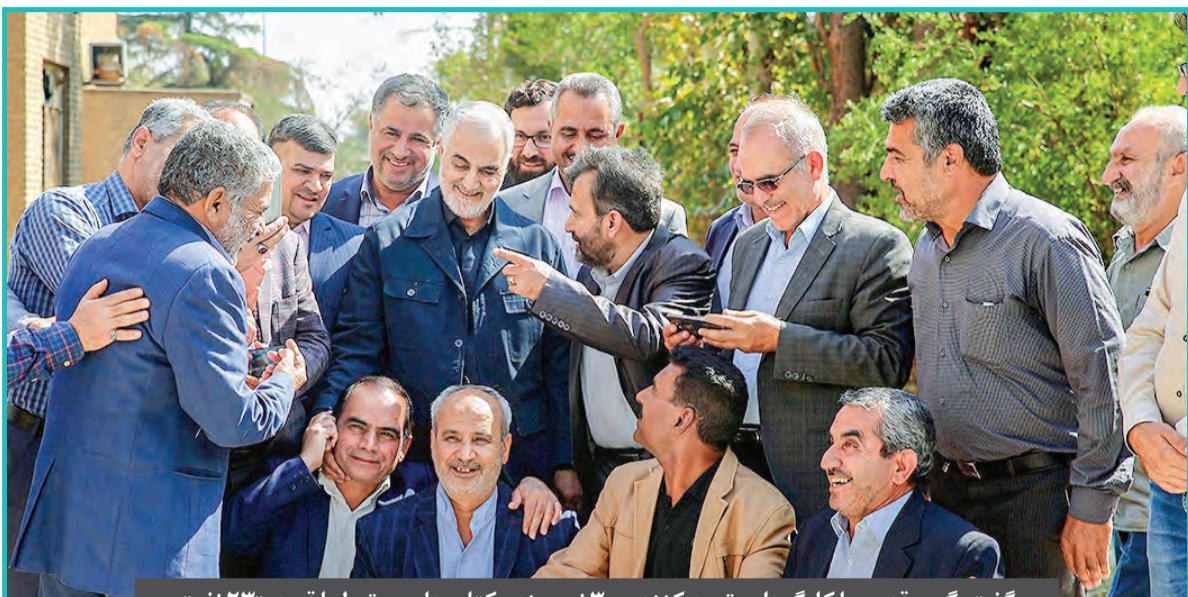
گفت و گو قدس با کارگردان، تهیه کننده و ۳ نویسنده کتاب های مرتبط با قصه «۲۳ نفر»