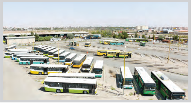
بخش اتوبوسرانی شهرداری قوچان

پیشیار خاطر‌نشان کرد: با توجه به اینکه اتوبوس‌ها شرایط نگهداری خوبی نداشت و شرکت مراقبت درستی از آن‌ها انجام نمی‌داد خسارات وارده بیشتر می‌شد که با دستور دادستان قوچان ۳۱ دستگاه اتوبوس متوقف و لوازم موجود در اتوبوس و دفتر پارکینگ برای جلوگیری از سرقت با حضور کارشناس دادگستری و نماینده نیروی انتظامی در مورخ ۹۸/۶/۲۷ صورت‌جلسه و به محل پارکینگ سازمان حمل و نقل شهرداری منتقل شده است.