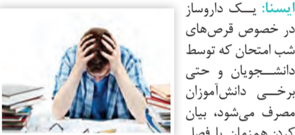
ایستنا: یک داروساز

در خصوص قرص‌های شب امتحان که توسط دانشجویان و حتی برخی دانش‌آموزان مصرف می‌شود، بیان کرد: همزمان با فصل