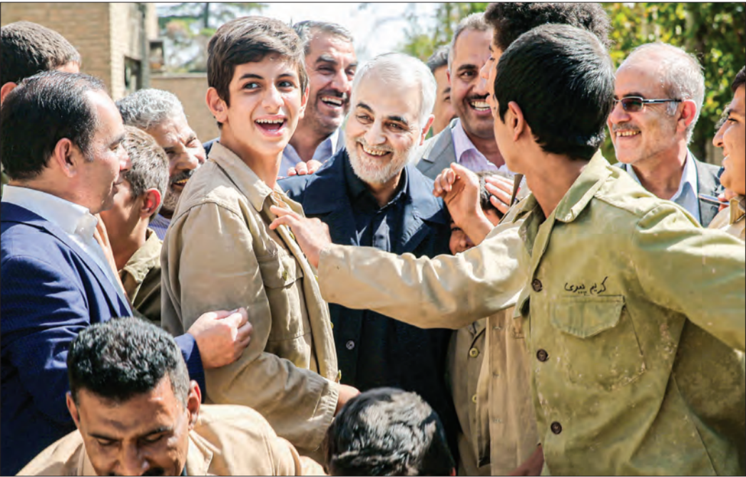
عکس‌های کشتار دیده‌شده از بازدید سردار شهید قاسم سلیمانی از پشت صحنه ۱۳۹۸ نقرو

درباره اینکه سردار سلیمانی به عنوان چهره‌ای که اقتدار نظامی او در انظار پررنگ‌تر است، اما حضورشان سر صحنه فیلم‌برداری فیلم «۲۳ نفر» نشان از دغدغه‌های فرهنگی ایشان داشت، می‌گوید: تأکید سردار برای ساخت