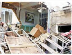
شمال شرق این شهر خبر داد.

خط قرمز: مدیر روابط عمومی آتش‌نشانی مشهد از امداد رسانی آتش‌نشانان و ناجیان سسه ایستگاه در پی انفجار گاز شهری در یک منزل مسکونی در