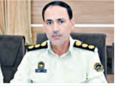
به گزارش پایگاه خبری

خط قرمز: سرپرست پلیس آگاهی استان از کشف دو انبار کالای قاچاقی به ارزش ۳ میلیارد و ۲۰۰ میلیون ریال در مشهد خبر داد.