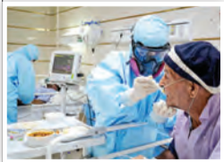
بجنورد / خبرنگار قدس: