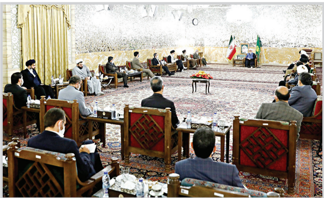
تولیت آستان قدس رضوی در دیدار مدیران سازمان‌های علمی و فرهنگی این آستان

آستان | تولیت آستان قدس رضوی مهم‌ترین شاخص حرکت فرهنگی آستان قدس رضوی را به زانو درآوردن دشمن معرفی و تصریح کرد: برای از کار انداختن ماشین ضدفرهنگی دشمن باید به فرهنگ بها دهیم چون هم و غم دشمن همین است.