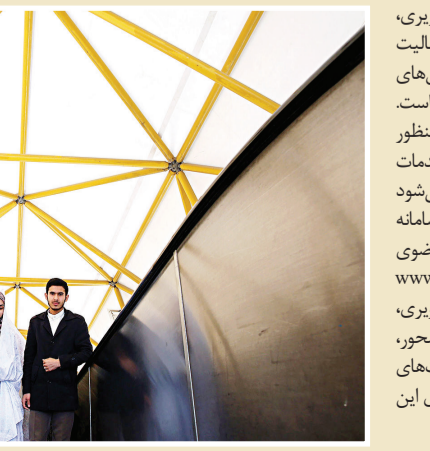
تولیت آستان قدس رضوی در دیدار مدیران سازمان‌های علمی و فرهنگی این آستان

حجت‌الاسلام والمسلمین مروی با تأکید بر اینکه پیشرفت سخت‌افزاری در عرصه‌های مختلف منتهای پیشرفت در عرصه فرهنگی و نرم‌افزاری و سبک زندگی، به تعبیر مقام معظم رهبری موجب استحاله و از بین رفتن ماهیت واقعی ما خواهد شد، بیان کرد: در این ماجرای شیوع بیماری کرونا شاهد بودیم که چطور در کشورهای غربی که در عرصه‌های گوناگون سخت‌افزاری به ظاهر پیشرفت‌هایی دارند و نه با تنگنای مالی و نه تحریم روبرو هستند، چه اتفاقاتی در روشنگارهایشان افتاد و چه صفاهای طولانی برای تهیه مواد غذایی و... تشکیل شد ولی یکی از این اتفاقات در کشور ما که سال‌ها تحت فشار تحریم و تنگنا بوده، نیفتاد و این نمایانگر فرهنگ غنی تمدن و ما را می‌کند. ما هم به پیروی از فرمایش رهبر معظم انقلاب، سهمی در ساختن تمدن نوین اسلامی بر عهده داشته باشیم، باید به تقویت امور فرهنگی که شالوده و زیربنای این تمدن است، توجه کنیم و وظیفه آستان قدس رضوی به عنوان پیشگام فرهنگی ایران اسلامی، باید هدایت، راهبری و جریان‌سازی در این مسیر باشد. تولیت آستان قدس رضوی افزود: ما در جبهه فرهنگی تمدن نوین اسلامی با تهاجم فرهنگی جهان استکبار مواجه هستیم، ارایش ما باید