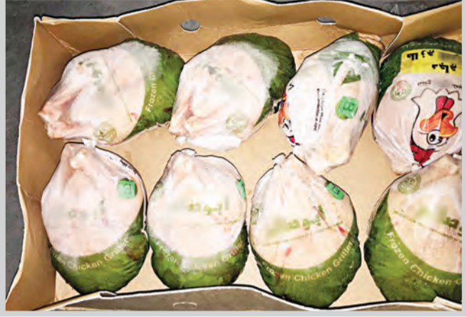
عکس ها : اختصاصی قدس

بررسی‌ها حاکی از آن بود که این محموله ۲۰ تن حجم دارد، برخی از افراد حاضر در محل مدعی بودند این محموله بی‌هویت و بی‌نام و نشان صادر می‌شود! اما هیچ سندی برای صادرات قانونی آن ارائه نکردند. ماجرا آن‌قدر مشکوک بود که این احتمال هم می‌رفت این محموله‌ها از کشور عربی به صورت غیرقانونی وارد ایران شده باشند.