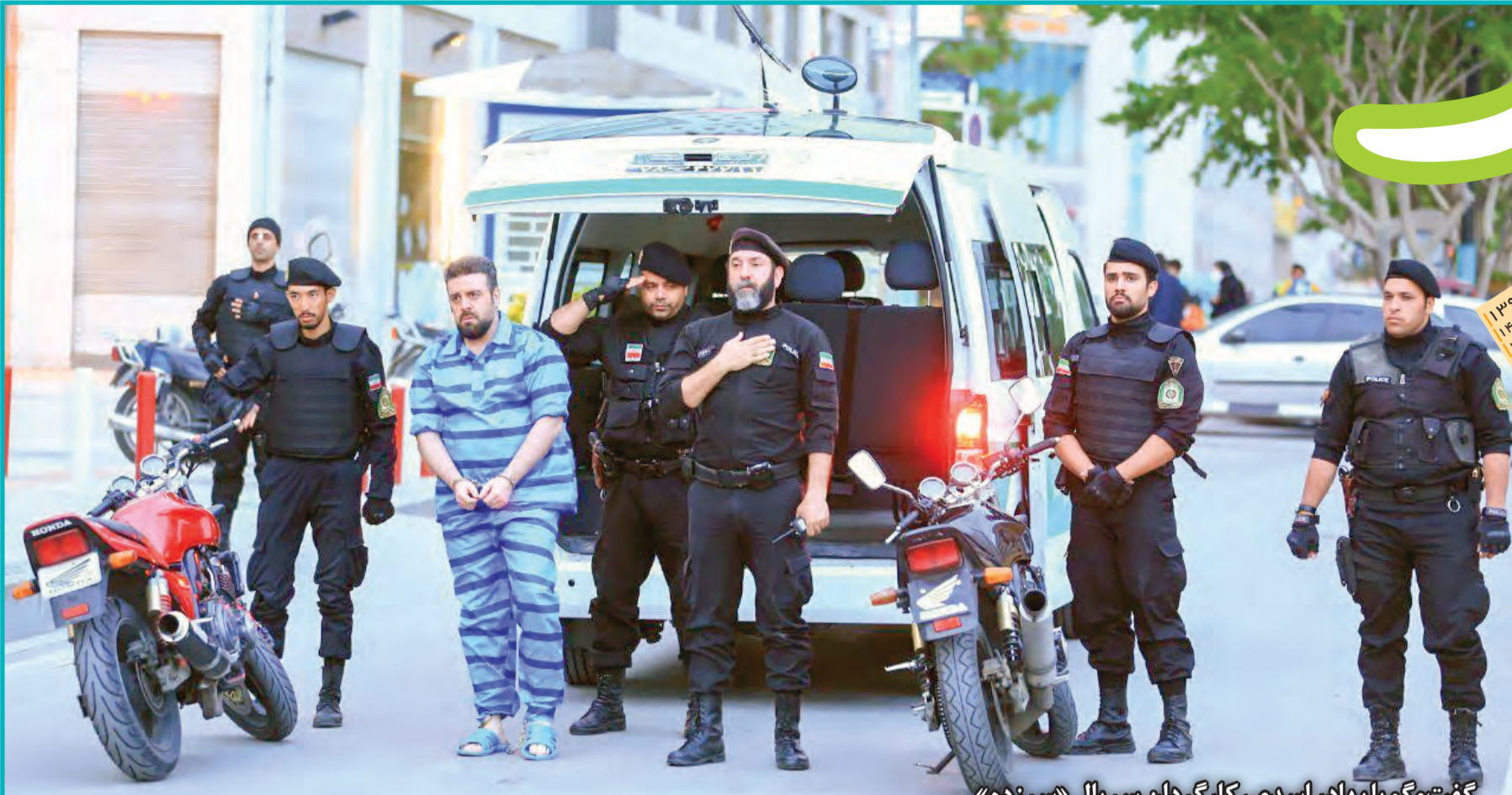
گفت و گو با بهادر اسدی، کارگردان سریال «سرزده»