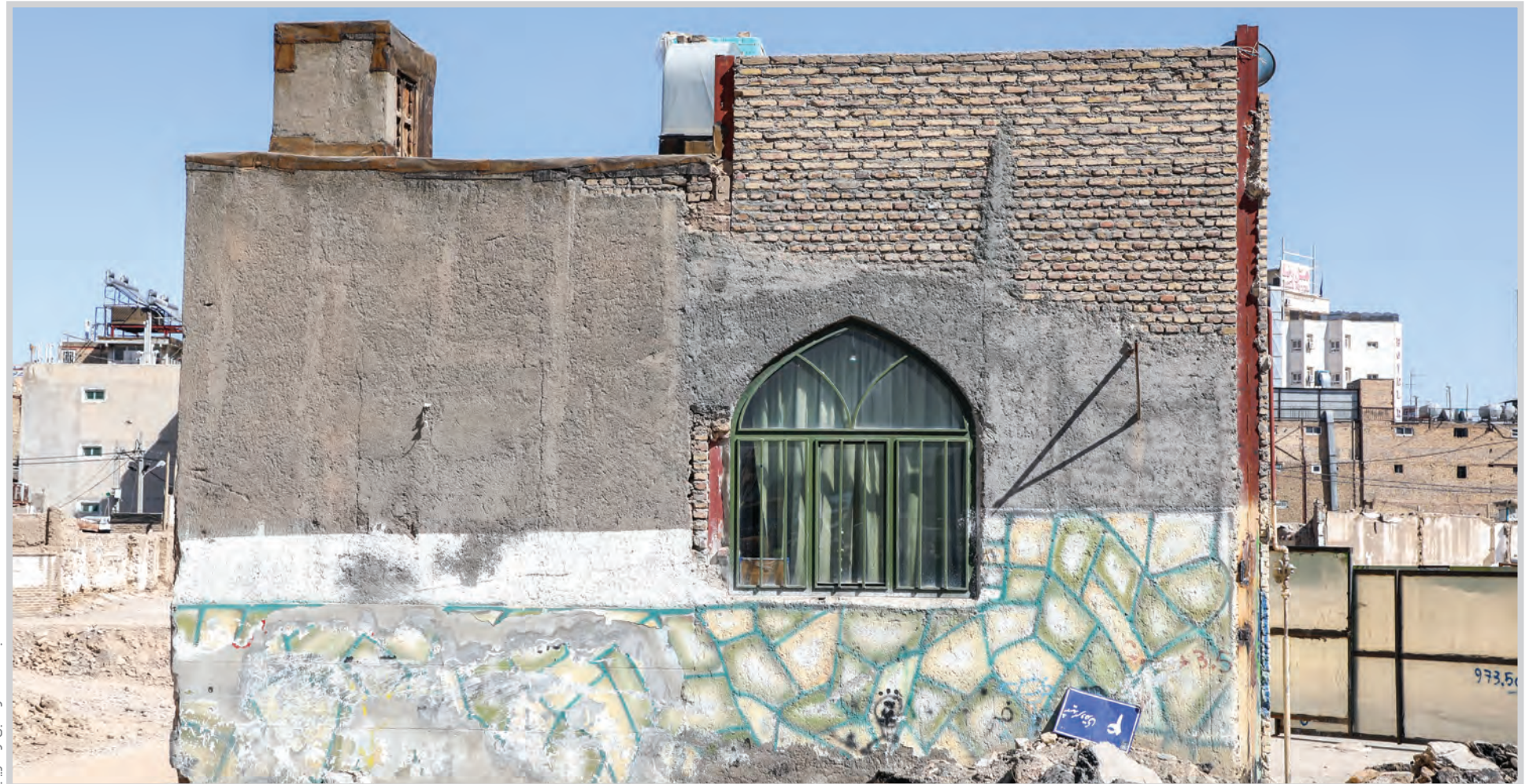
مسجد «هفت در» قبل از تخریب