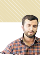
آندمه بودت تا نظریه‌های جنگ را به هم بریزد