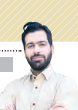
آندمه بودت تا نظریه‌های جنگ را به هم بریزد

رزمدگان میرا درست می‌کرد، میرای میسید… خیرالنسا برای هر چه تلخاکی در جنگ است، جنگ سیاه است و پر از دود و خون و سیاهی… خیرالنسا به زنان روستاهای رنگارنگ می‌جدا د تا برای فرزندانشان در جبهه‌های و دستگن و کلاه بیاقتد تا در برابر دو دیو سرما و دشمن بختی بختند. خیرالنسا آمده بود تا پشت رزمدگان ایرانی هیچ‌وقت خالی نباشد!