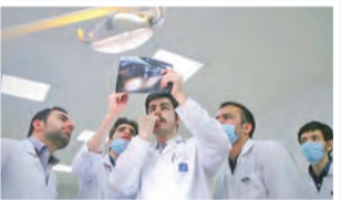
یک مسئول دانشگاه خیر داد