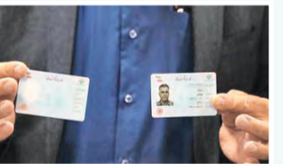
سخنگوی سازمان ثبت احوال: