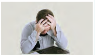
عضو هیئت علمی دانشگاه بیان کرد