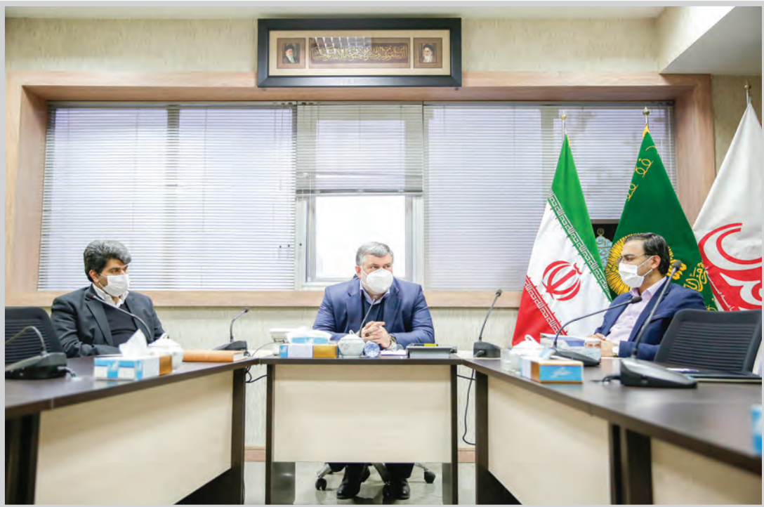
تکمیل خطوط معادن راه‌آهن قدس

کنیم. استاندار خراسان رضوی با بیان اینکه اگر بستر سرمایه‌گذاری در استان فراهم شود به صورت خودجوش سرمایه‌گذاران حضور پیدا خواهند کرد، افزود: یکی از پشتوانه‌های توسعه استان، بخش کشاورزی است که در این زمینه باید مدیریت استفاده از آب، توسعه کشت گلخانه‌ای، احیای قنات و آبخیزداری مورد توجه قرار گیرد.