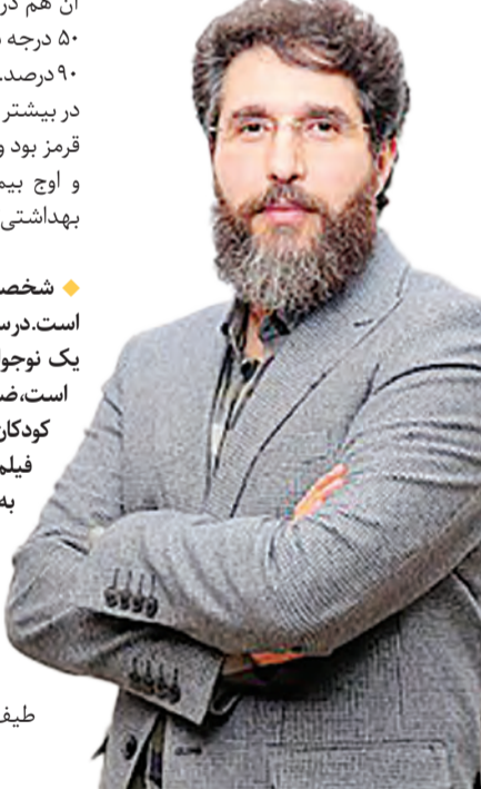
❖ نقد فیلم

بزرگ‌ترین مشکل کار کردن در حوزه دفاع مقدس این است که وقتی بار معنایی و مسئولیت چنین ژانر و فضایی را به دوش می‌کشید باید طوری عمل کنید که شئون و جایگاه آن ژانر حفظ شود. اگر قرار است ورود جدی به حوزه دفاع مقدس داشته باشیم باید فیلمی بسازیم که به این حوزه اضافه کند. اگر بنا باشد فیلمی ضعیف درباره جنگ و دفاع مقدس ساخته شود همان بهتر که به این حوزه ورود نشود. آنچه مد نظر من و گروه سازنده بود اینکه فیلمی در شأن و شایسته مقاومت مردم و رزمندگان در دوران دفاع مقدس ساخته شود. وقتی فیلم‌نامه «یدو» را خواندم دیدم که نوع نگاه و زاویه دید آن به مقوله جنگ و