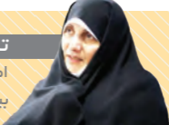
خاتم طاهر همدز در نخستین بخش از مجموعه کتاب «حیات اجتماعی در سایه قرآن» که توسط مرکز رزق آریا ابتکنا تهیه شده، می‌گوید: «کودکانی که به سن بلوغ نرسیده‌اند وقتی می‌بینند اعضای خانواده سحری و افطاری می‌خورند به شدت تلاش می‌کنند به آن‌ها پیوندند؛ اصلا منع این کار شويد، این اقدام بسیار خوب است. امام مودعی(ع) می‌فرمایند: به بچه‌ها فرستادن سحری خوب است. بزرگوار، برخی از مادران برای این موضوع ایذاهایی خود می‌هم دارند. مدعا می‌گفتند ما کمی هم سیبیر می‌سرخ می‌گیریم تا بوی آن بچه‌ها را بخورند کند. همچنین مادران چیزهایی که منع تشنگی بچه‌ها می‌شود را در غذای سحر و افطار اضافه‌کنند.»