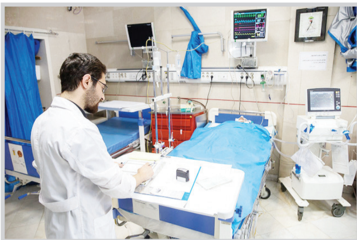
تجسس در بیمارستان

پزشکی نیز اعلام شده بود در اقدام مشترک حضور پیدا کنند. زمانی که به نزدیکی بیمارستان خصوصی مد نظر می‌رسیم، ابتدا برای بررسی نامحسوس ماجرا با چند نفر از افرادی که از بیمارستان ترخیص شده‌اند صحبت می‌کنیم. نکته جالب این بود که در بیمارستان مذکور به هیچ عنوان به آن‌ها اعلام نمی‌شد گرفتن ساک همراه بیمار اجباری است و همگی مدعی بودند نیروهای خدمه بیمارستان به محض حضور بیمار در بخش، از همراهی او درخواست می‌کردند ساک را از انبار تحویل بگیرد. حتی پول ساک را هم به صورت نقدی پرداخت می‌کنند اما روی صورت‌حساب بیمارستان درج نمی‌شد.