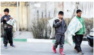
معاون امور اجتماعی سازمان بهزیستی کشور: