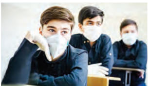
تشریح کارکردهای بیمه دانش آموزی