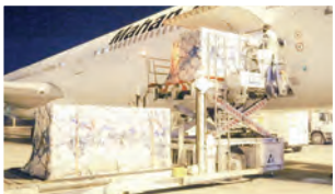
دبیرکل جمعیت هلال احمر: