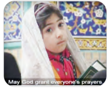
May God grant everyone's prayers

چگونگی انتقال آب توسط سقاها به حوض مسجد و سقاخانه صحن عتیق، به تصویر کشیده شده که امروزه دیگر وجود خارجی ندارد. میلارت به دلیل شروع جنگ جهانی دوم و محدودیت‌هایی که در پی آن به وجود آمد، نتوانست فیلم خود را تمام کند. او عمری طولانی داشت و در سال ۱۹۹۷، در ۹۵ سالگی درگذشت. به این ترتیب، قدیمی‌ترین مستندنگاری با شیوه ثبت تصاویر متحرک از حرم رضوی مربوط به سال ۱۳۱۸ است؛ یعنی حدود ۸۲ سال پیش. درگذشت، به این ترتیب، قدیمی‌ترین مستندنگاری البته در آشفته‌بازار فضای مجازی، فیلم کوتاه و یکی، دو دقیقه‌ای هم با عنوان «تصویربرداری کلارمونت اسکرین»، کنسول‌پار انگلیس در مشهد، منتشر شده است و انتشاردهندگان احتمال می‌دهند زمان گرفتن آن، مربوط به سال ۱۳۱۰ باشد؛ موضوعی که هم از منظر تاریخی و هم از نظر نوع پوشش مردم در این فیلم، جای تردید جدی دارد و فیلم مذکور هم فاقد شناسنامه دقیق تاریخی است و نمی‌توان آن را از نظر سندیت، مانند فیلم میلارت دانست. در دهه‌های بعد نیز به مناسبت‌های مختلف، دوربین فیلم‌برداری در حرم مطهر به کار گرفته شد؛ مثلاً فیلمی حدوداً دو دقیقه‌ای از فضای حرم رضوی در دهه ۱۳۴۰ وجود دارد که نقاره‌زنی در آن را به تصویر می‌کشد و نماهایی از بالاخیابان، صحن عتیق و پرواز کبوتران بر فراز گنبد طلا را نمایش می‌دهد. اوایل دهه ۱۳۵۰ نیز گروه مستندساز ژاپنی که مستند معروف «جاده ابریشم» را می‌ساختند، سکانس‌هایی از فیلم خود را در مشهد و در جوار حرم رضوی تهیه کردند که بسیار محدود و حاشیه‌ای بود. واقعیت این است که به طور کلی، مستند مستقل با دست‌کم مهمی درباره حرم رضوی تا پس از پیروزی انقلاب اسلامی ساخته نشد.