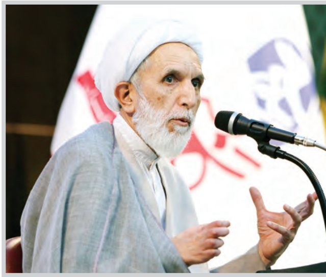
نخستین آرشین مصیبتی

مهدی خالدي: نشست هم‌اندیشی سیاسی «بصیرت» و جلسه پرسش و پاسخ با موضوع انتخابات ریاست جمهوری ویژه اصحاب رسانه، عصر روز گذشته به همت کانون بسیج رسانه روزنامه فرهنگی قدس و همیاری سازمان بسیج رسانه خراسان رضوی در روزنامه قدس برگزار شد. در این نشست که با حضور حجت‌الاسلام والمسلمین مهدی طائب، رئیس شورای قرارگاه راهبردی عمار برگزار شد مهم‌ترین مسائل مربوط به انتخابات پیش روی کشور مورد بحث و بررسی قرار گرفت.