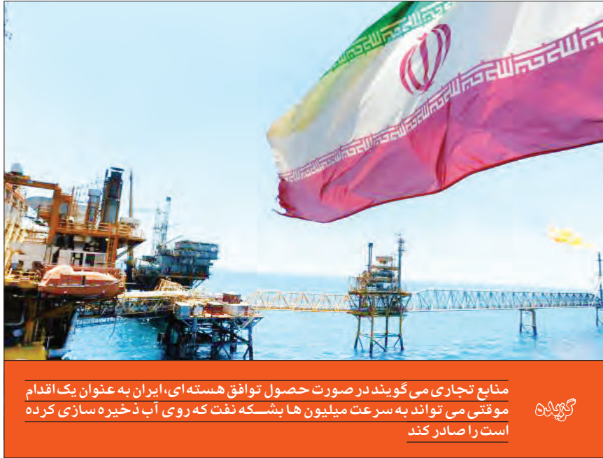
منابع تجاری می‌گویند در صورت حصول توافق هسته‌ای، ایران به عنوان یک اقدام موقتی می‌تواند به سرعت میلیون‌ها بشکه نفت که روی آب ذخیره سازی کرده است را صادر کند

مجلس نیز درباره آینده بازار نفت ایران، می‌گوید: بازار نفت در اوایل سال ۹۹ چندان مطلوب نبود اما پس از آن به مرور شرایط کشور در این حوزه بهتر شد. بهبود آن هم به دو دلیل است، نخست اینکه، کرونا در ابتدای همه‌گیری موجب شگفتی و غافلگیری تمام دنیا شد و سبب شد مسائل اقتصادی تحت تأثیر آن قرار بگیرد و در نتیجه آن، خرید نفت در دنیا کاهش یافت و قیمت نفت و به تبع آن فرآورده‌های نفتی پایین آمد. اما زمانی که جلوتر آمدیم و مردم دنیا خودشان را با این بیماری وفق دادند، همین موضوع سبب شد مصرف نفت افزایش پیدا کند و زمانی که مصرف