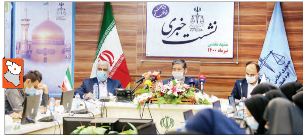
در حوزه سرپرستی کودکان کار نیز اقدام‌های خوبی صورت گرفته و همت و تلاش همه مسئولان سبب شده است تا امروز سر چهارراه‌ها شاهد حضور و پراکندگی کودکان کار نباشیم و تقریباً همه این کودکان ساماندهی شدند