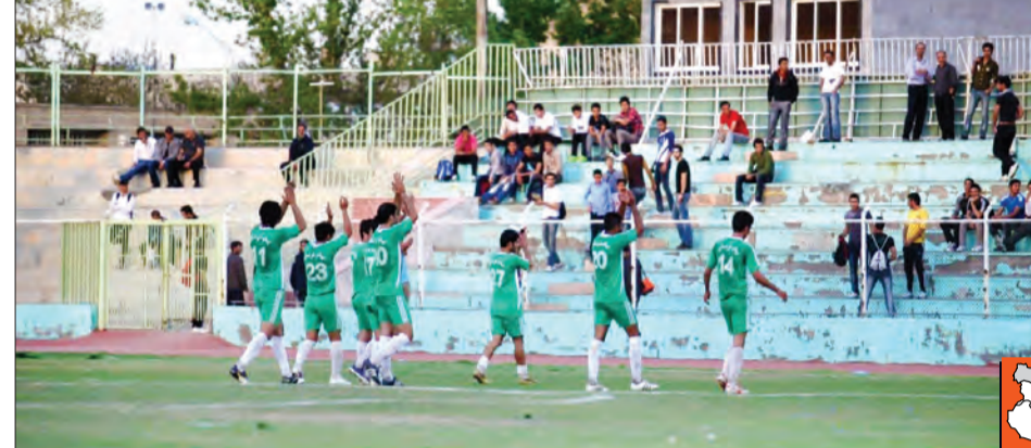
برنامه ریزی ما این است باشگاه پیام برای خود و سایر باشگاه ها در رده های پایه بازیکن سازی کند و بازیکنانی که از باشگاه ما ملی پوش می شوند به تیم های دیگر فرستاده شوند

گرچه هنوز اتفاق خاصی در حیطه فوتبالی برای این باشگاه نیفتاده و فعلاً با شکل گیری مدرسه فوتبال و تیم های رده پایه پیام توس خراسان موجودیت خودش را اعلام کرده است، اما شنیده می شود با اتمام رقابت های باشگاهی در لیگ های دو و سه باشگاه های کشور مسئولان این باشگاه درصدد هستند تا امتیاز بازی در یکی از این دو لیگ خریداری کرده و در عرصه رقابت های باشگاهی کشور به طور رسمی کار خودشان را شروع کنند.