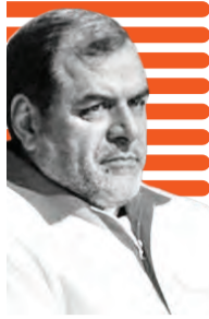
طرح «نذر آب ۴» از ۱۵ شهرستان کم آب آغاز شد

به هنرمندان و پژوهشگران ادبیات شفاهی اقوام خراسان شمالی و ایجاد شورای سیاست‌گذاری برای پژوهش‌های راهبردی در راستای میراث ناملموس از دیگر موضوعات تفاهم‌نامه و همکاری مشترک با کانون پرورش فکری است.