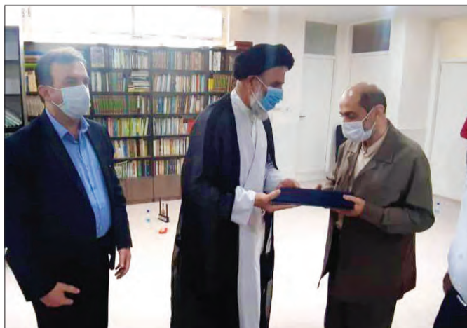
ایجاد پایگاه فوریت‌های پزشکی جاده‌ای در سه‌راهی شهید بزرگ هویزه و همچنین بازسازی بخش فرسوده بیمارستان شهر هویزه دو خدمت جدید آستان قدس رضوی برای مردم خوزستان است که در دهه کرامت کلید خورد و در اختیار مردم عزیز این منطقه قرار خواهد گرفت.

۴۰ سال پیش نیز برای بازسازی شهر هویزه وارد میدان شد و امروز هم خرسندیم که با دستور حجت‌الاسلام والمسلمین مروی، تولیت محترم این آستان، کارهای ماندگار و زیربنایی دیگری در این شهر که شهر مقاومت و ایثار است توسط دستگاه منتسب به